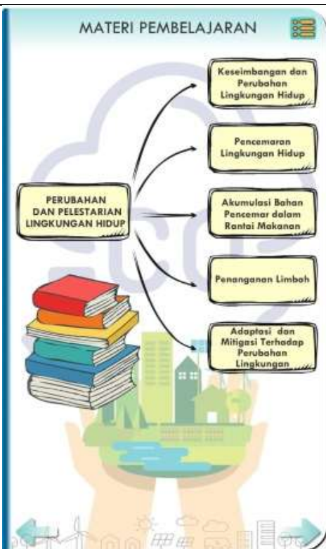
Gambar 4. Tampilan Halaman Materi