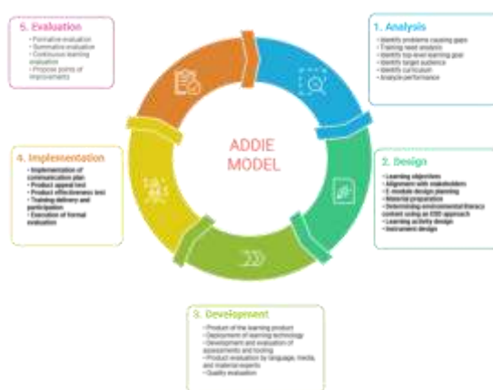
Gambar 1. Tahap Pengembangan Model ADDIE

Prosedur penelitian pengembangan ini mengikuti model ADDIE yang terdiri dari lima tahap utama, yaitu analisis, perancangan, pengembangan, pelaksanaan, serta evaluasi (Branch 2009).