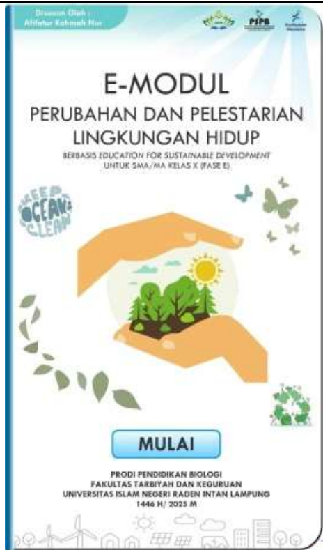
Gambar 2. Tampilan Halaman Judul